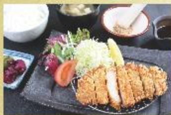
うまい豚ロースカツ御膳