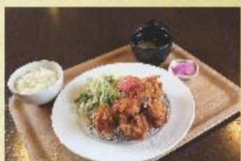
自家製ザンギ御膳