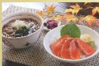
炙りサーモン丼ミニ蕎麦セット