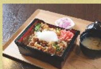
スタミナカルビ重