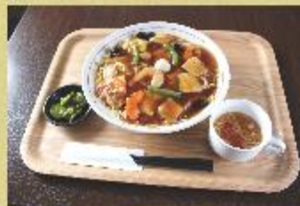
五目館かけ焼きそば