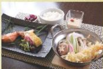
鮭のカマ焼きと鍋焼きうどんセット