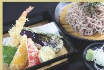
海老と季節野菜の天婦羅と蕎麦セット