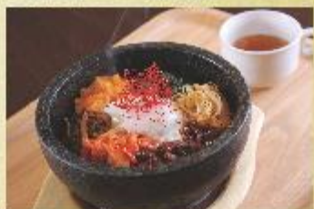
熱々石焼きビビンバ